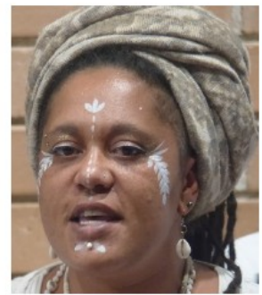
Des visages, des expressions, des impros... inoubliables !!!