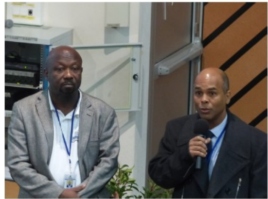
Des présences remarquées et remarquables.