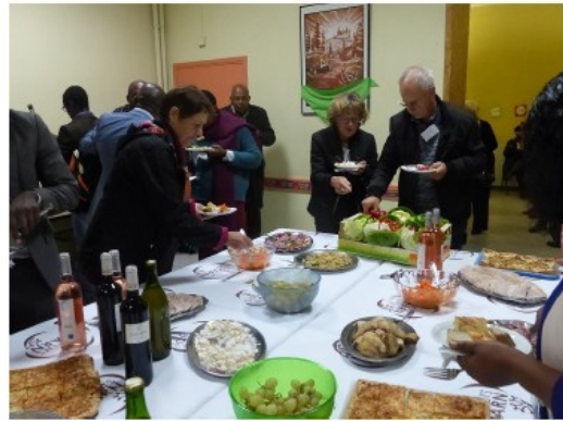
Des moments de convivialité et de restauration aux saveurs locales