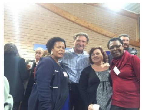
Des moments de culture, de détente, d'amitié et de belles émotions !!!