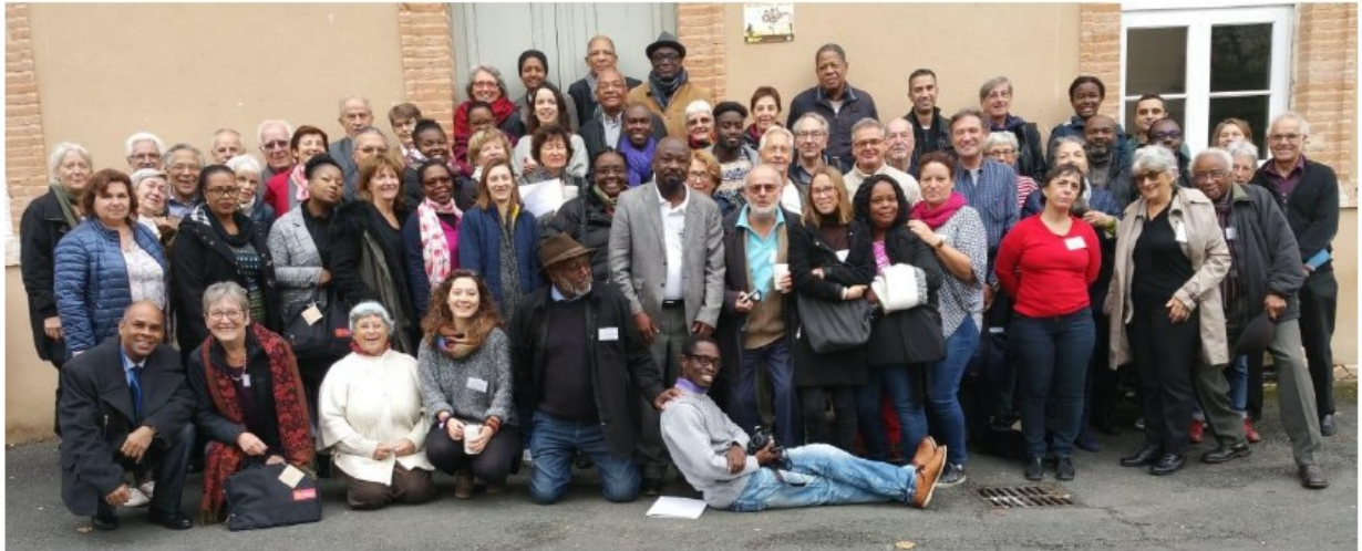
Des RN 2018, quantitativement et qualitativement riche !!!