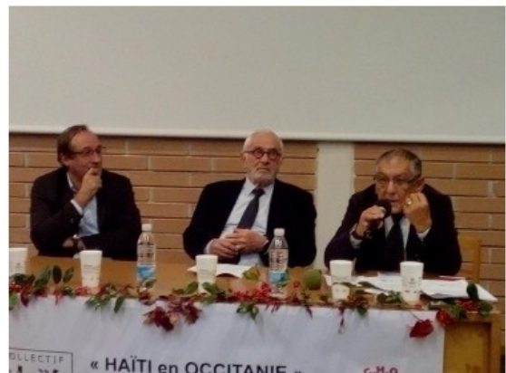
Des ateliers dynamiques, des tables-rondes riches et des facilitateurs éclairants !