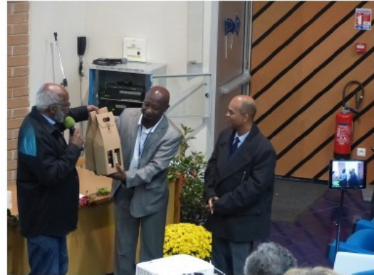
Des produits d'Occitanie offerts en souvenirs.